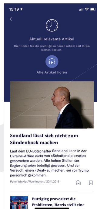
Abonnieren von Push-Nachrichten (links). Individuelle Leseliste mit Audio-Funktion (rechts).

Headless CMS-Integration. Das headless CMS und die Ausspielungssoftware bilden bei Forward Publishing eine nahtlos integrierte Einheit. Es braucht keine langwierigen und aufwendigen Projekte, um diese grundlegenden Elemente einer Publishing-Architektur miteinander zu verbinden und umgehend zu nutzen.